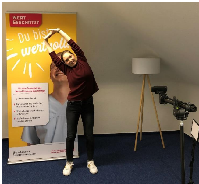
Ein Blick hinter die Kulissen bei der Bewegten Pause.

Neben diesen Schwerpunktthemen kamen auch Führungskräfte auf ihre Kosten und konnten durch Vorträge zur Wertschätzung im Führungsalltag, zur gesunden Selbstführung und durch Videotrainings, wie z.B. zum Thema „Wie fördere ich Meinungsvielfalt im Team?“, ihre Mitarbeiter- und auch die eigene Führung reflektieren.