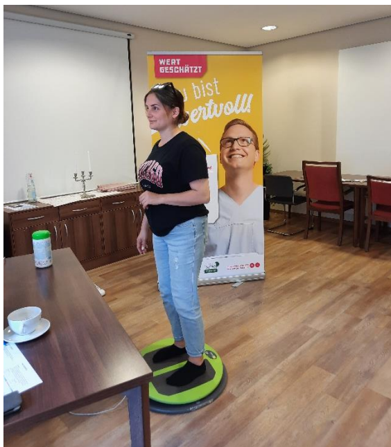
Abbildung 1: Mitarbeiterin auf dem S3-Check

Der Gesundheitstag beinhaltete - dem Handlungsfeld „Alloheim bewegt sich“ entsprechend - verschiedene Angebote. So konnten sich die Mitarbeiter:innen an der Smoothiebar einen frischen Smoothie und gleichzeitig Tipps und Anregungen für eine gesunde Ernährung einholen.