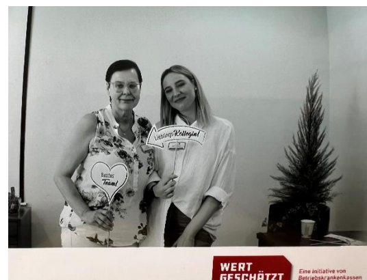
Abbildung 3: Mitarbeitende in der Fotobox

Nach Abschluss des Gesundheitstages freuen wir uns nun, die Arbeit der GESTE weiter vorantreiben zu können, um mit bedarfsgerechten Maßnahmen die Gesundheit der Mitarbeiter:innen weiter stärken zu können. Wichtige Bausteine in der weiteren Projektarbeit der GESTE werden die Themen Kommunikation, Wertschätzung und Führungskräftebildungen sein. Viele Vorhaben und viel Motivation, diese auch umzusetzen, sind auf jeden Fall vorhanden.