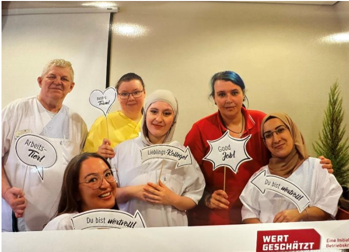
Abbildung 2: Mitarbeitende in der Fotobox

Ein weiteres Angebot war die Fotobox der Initiative WERTGESCHÄTZT. Diese fand sehr guten Anklang. Die Fotos wurden genutzt, um sie als Erinnerung in den Teamräumen und in der Eingangshalle auszuhängen, das Team Alloheim vorzustellen und gleichzeitig die Identifikation der Mitarbeiter:innen mit dem Alloheim in Bramsche zu stärken.